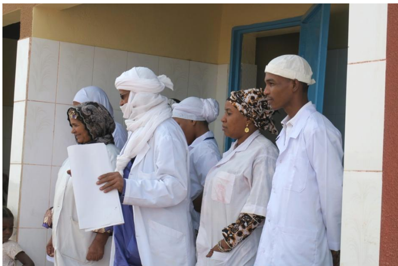
und das Mediziner-Team der Mobilen Klinik